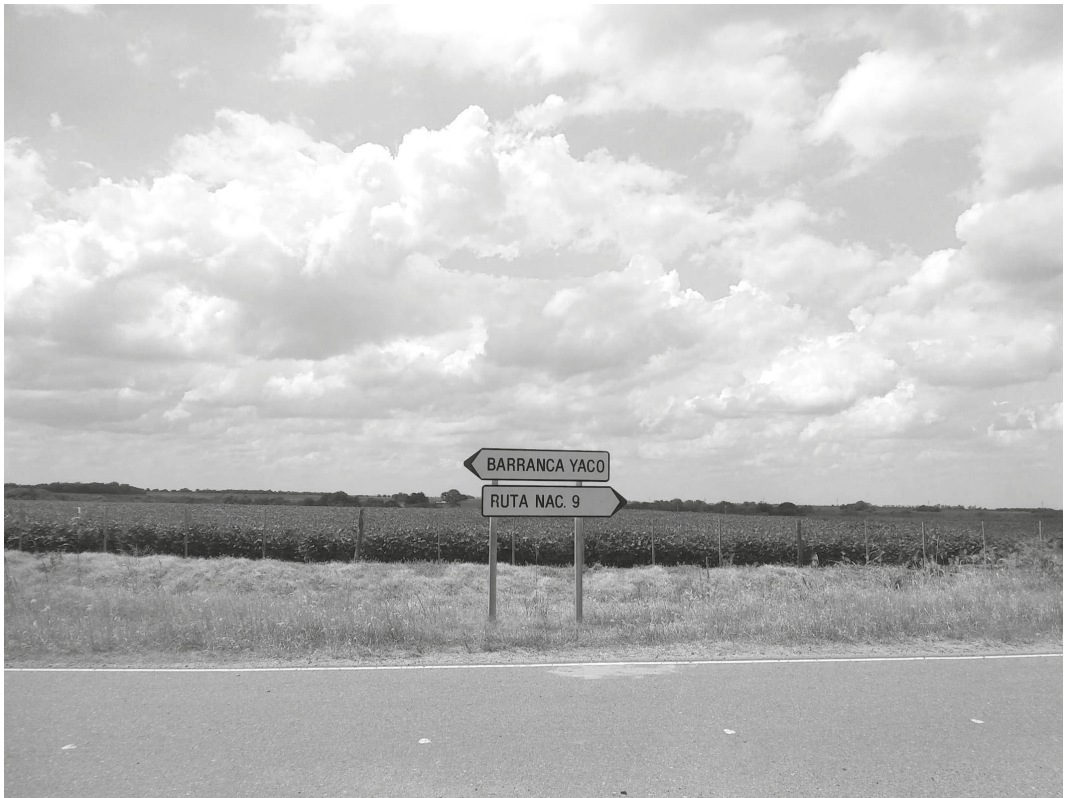
Fig. 6. Campos de soja, 2025.