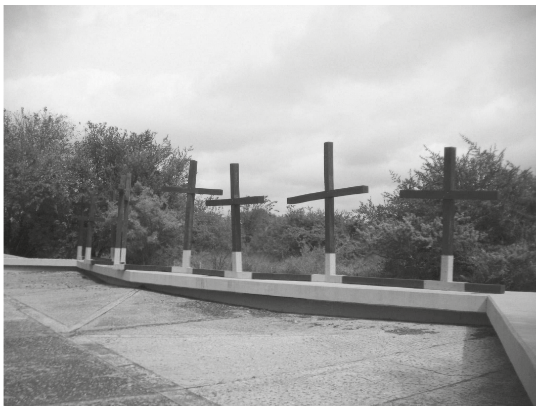
Fig. 4. Monumento en Barranca Yaco, 2008.

12 Es 2021 y un video breve promete volver sobre el asunto: desde un coche detenido en la banquina se ve una encrucijada, pasa la Ruta Nacional 9, orillada de soja. El auto se pone en movimiento, gira en U y banquina nuevamente; a la derecha, junto a una arcaica plantación de maíz, un cartel rutero indica: “Barranca Yaco 3”. El coche endereza y acelera hacia un lugar al que lo han conducido la historia, la literatura o la memoria. Lo hace sin gravedad, llevado por un contrapunto de música de cuarteto. Un título se superpone: “La saga de los mártires unitarios regresará”. 75