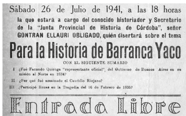
Fig. 2. Afiche de la Biblioteca Popular Mariano Moreno, La Calera, 1941. Disponible en : http://v.conabip.gob.ar/archivo_historico/2045gris001001-0

8 La voluntad de ser provincial es “la lección del ‘caos’ y de la ‘anarquía’ que resuena, a lo largo de un siglo, en el dolmen de Barranca Yaco”, dice Taborda en 1935. Al parecer, se trata de un dolmen más que “figurado”. Ya en los años veinte podía verse un cartel conmemorativo, que el diario Córdoba registra ahora junto al testimonio de un paisano centenario; “el paisaje, otrora salvaje, se ha dulcificado”, concluye. 43 La cuestión del monolito está dando vueltas pero, más que ella, interesa la luz incidental arrojada por la conmemoración sobre ese suelo duraderamente oscuro.