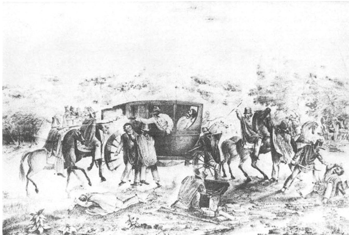
Fig. 1. Pablo Caccianiga, Asesinato del general Quiroga , Litografía. Buenos Aires, 1836, Museo Histórico General Pueyrredón.

cantar recogidas en 1921). 9 Así el difundido grabado contemporáneo de Pablo Caccianiga desplegará en primer plano el “atroz asesinato” y hará del monte apenas su telón. 10